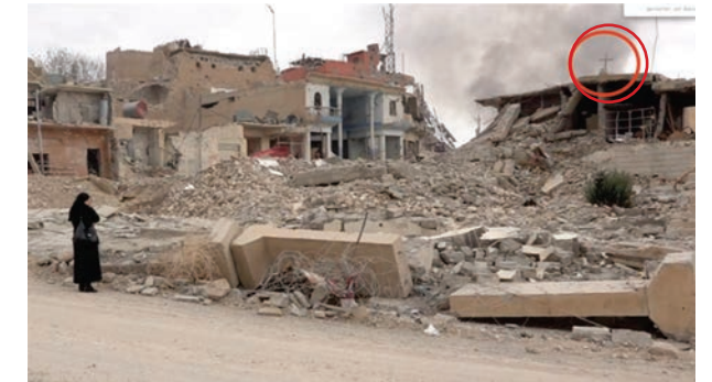
Von Jihadisten zerstörte christliche Kirche in Shingal Stadt, Irak

In islamisch dominierten Ländern, in denen die Scharia die Basis geltenden Rechts ist, existiert keine Glaubensfreiheit. So wird etwa im Ursprungsland des Islam, Saudi-Arabien, die Lossagung vom Islam mit dem Tod bestraft. Alle anderen Religionen haben in dem Land kein Existenzrecht.